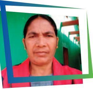
KOSI SODI ED