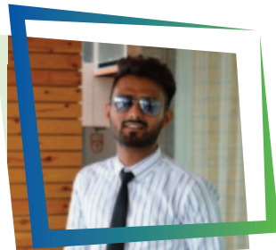
RAMJI KHATANA RD