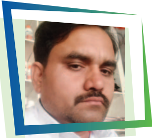
GIRI ACHUTGIRI GHANSHYAMGIR ED