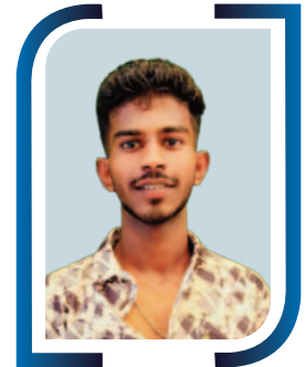
GANDIKOTA THIMOTHI ED