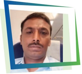
NAGNATH SHIVAJI URAMUNGE RD